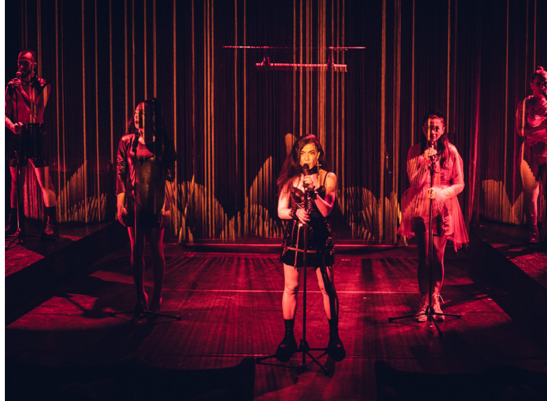
Trauma Kink af rumænske Giuvlipen. Pressefoto